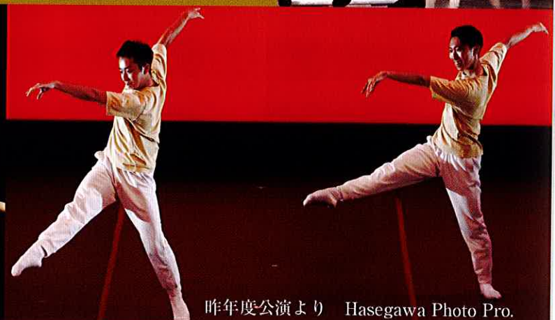
昨年度公演より